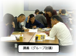
講義 (グループ討議)