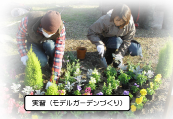
実習 (モデルガーデンづくり)