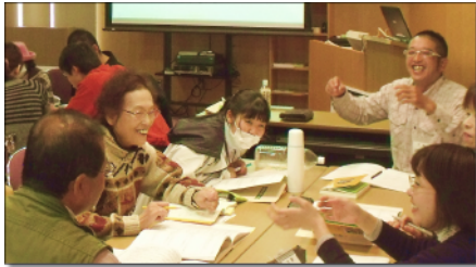
◆ 講義 (グループ討議)

そうした実践活動を円滑に推進するのが「初級園芸福祉士」であり、その人材を養成するのが「初級園芸福祉士養成講座」です。愛知県内の講座開催は今回で9回目です。園芸福祉活動に興味のある方はぜひ受講してみませんか。