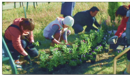
◆ 実習 (モデルガーデンづくり)