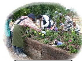
実習 モデルガーデンづくり