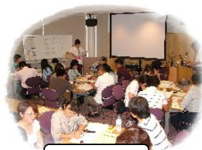
講義 グループ討議